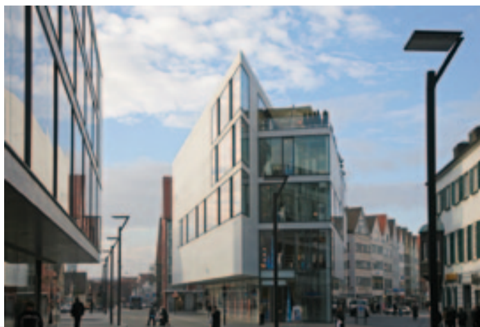
Neue Mitte von Ulm