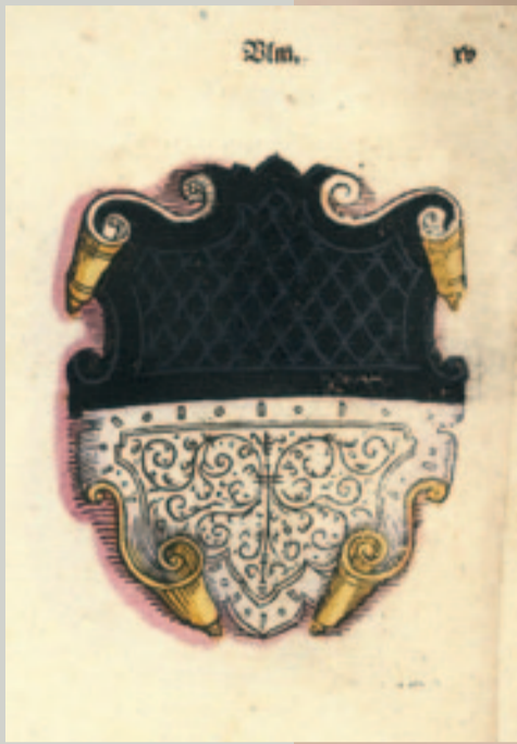
Wappen der Reichsstadt Ulm, frühes 16. Jh.